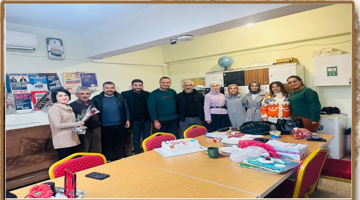
24 KASIM ÖĞRETMENLER GÜNÜ KUTLAMASI