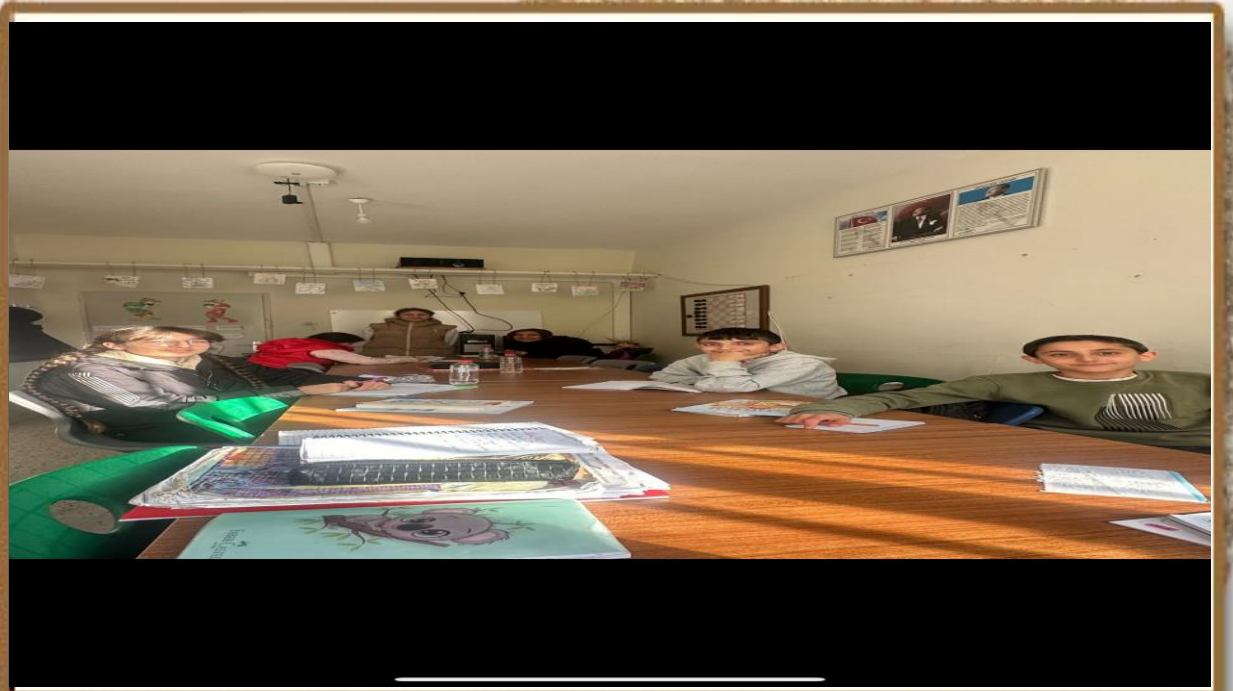
KİTAP OKUMA SAATİMİZ