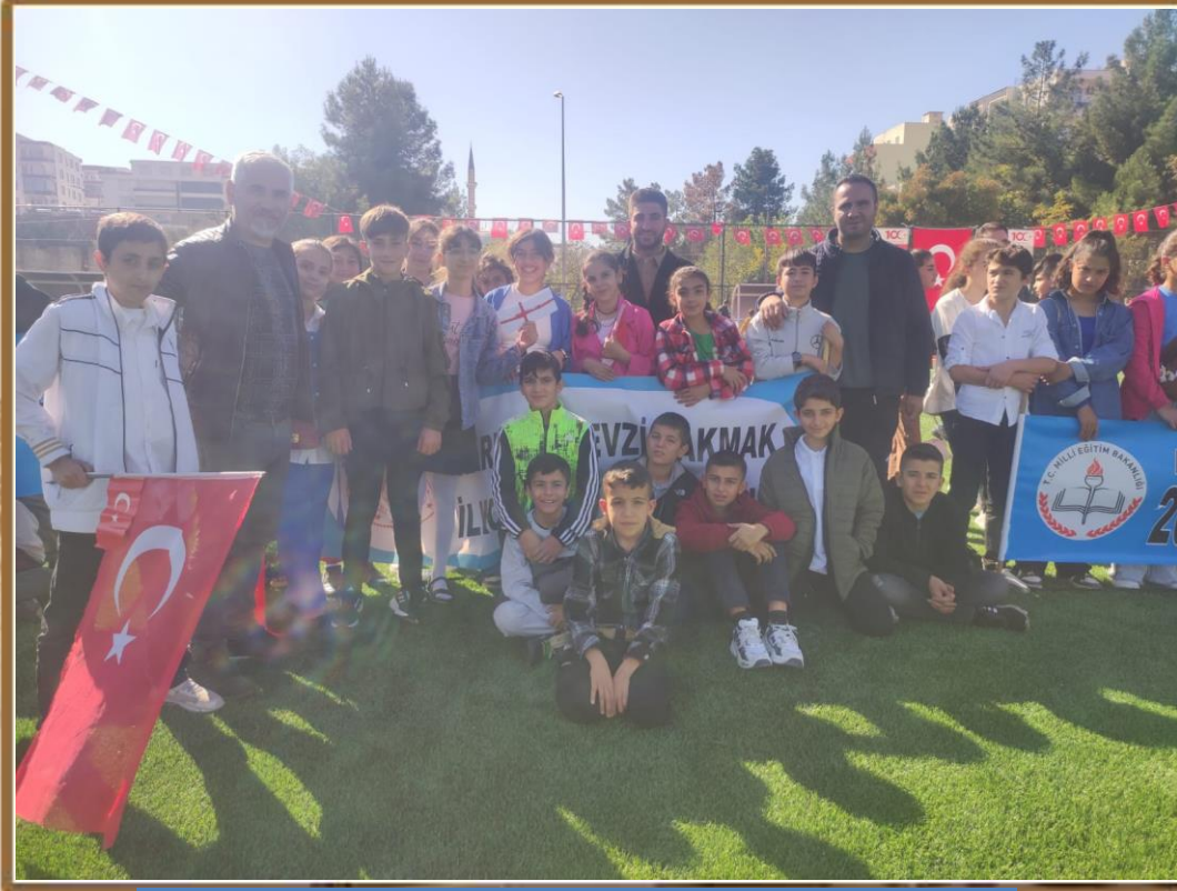
.29 Ekim Cumhuriyet Bayramı.