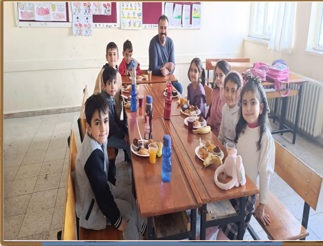
YERLİ MALI HAFTASI