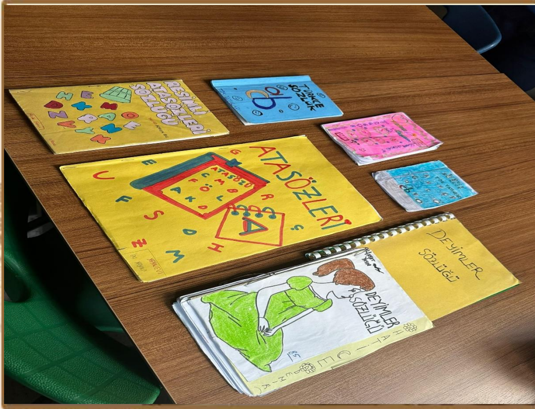
DİLİMİZİN ZENGİNLİKLERİ PROJESİ SÖZLÜK HAZIRLAMA ETKİNLİĞİ