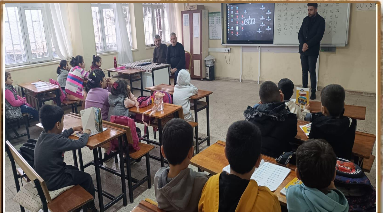
ÇEDES YAŞLILARA SAYGI ETKİNLİĞİ