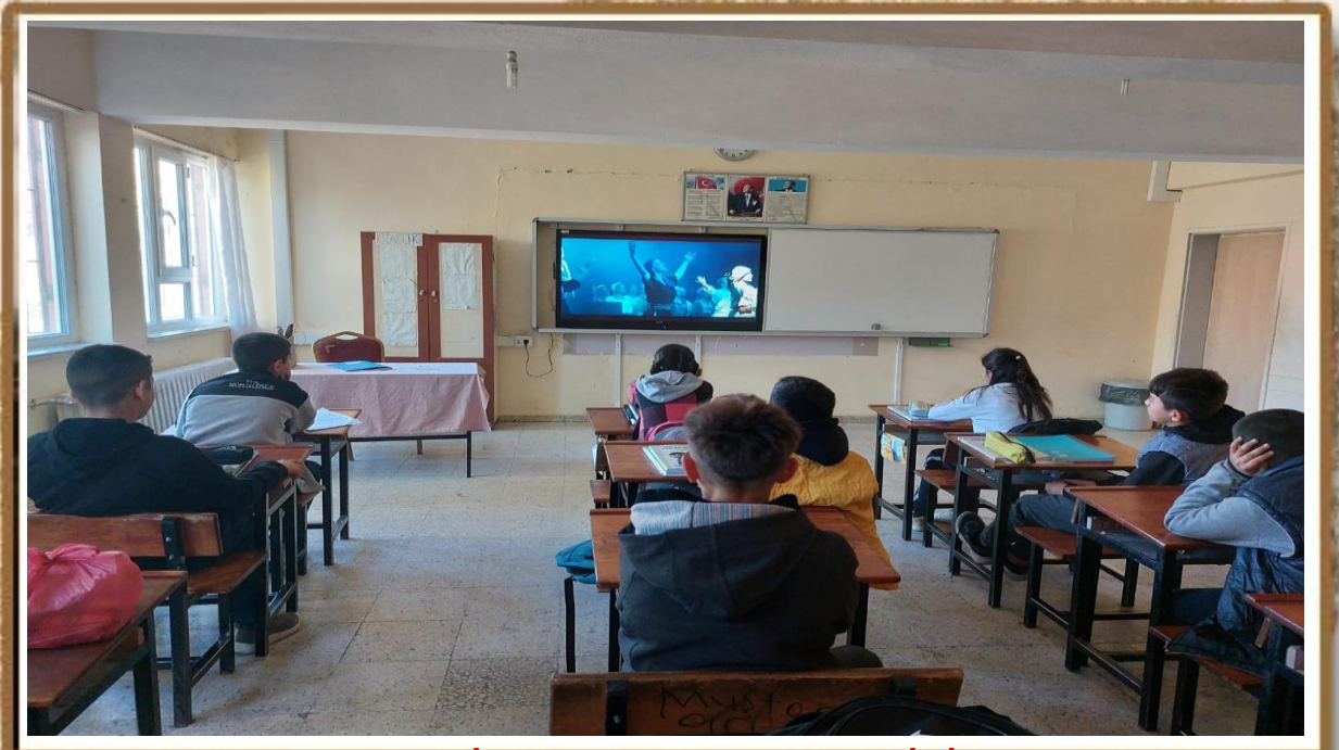
CUMHURİYET HAFTASINDA "DERSİMİZ CUMHURİYE DOĞRU" ADLI FİLM İZLETİLDİ